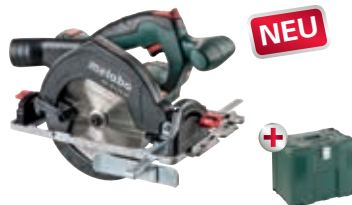
Akku-Handkreissäge KS 18 LTX 57 Bestell-Nr. 601857840