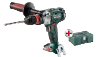
Akku-Schlagbohrmaschine SB 18 LTX Quick Bestell-Nr. 602200840