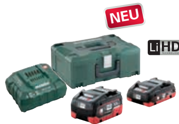
Basis-Set 1 x LiHD 5.5 & 1 x 4.0 Ah 1 x Ladegerät ASC 30-36 V Bestell-Nr. 685136000

Maschinen ohne Akku (Karkasse) + Basis-Sets jedes der abgebildeten Produkte für nur