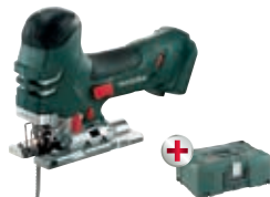
Akku-Stichsäge STA 18 LTX 140 Bestell-Nr. 601405840