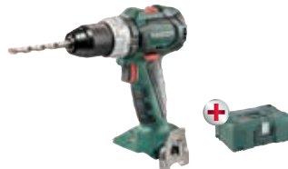
Akku-Schlagbohrmaschine SB 18 LT BL (Brushless-Motor) Bestell-Nr. 602316840