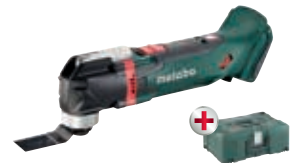
Akku-Multitool MT 18 LTX Bestell-Nr. 613021840