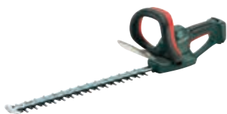
Akku-Heckenschere AHS 18-55 V Bestell-Nr. 600463850