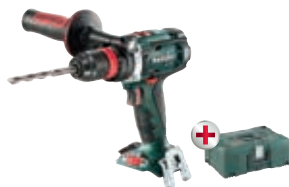
Akku-Bohrschrauber BS 18 LTX Quick Bestell-Nr. 602193840