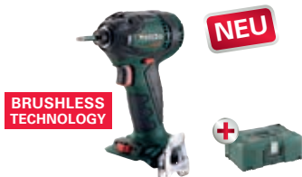
Akku-Schlagschrauber 1/4" SSD 18 LTX 200 BL Bestell-Nr. 602396840