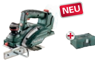
Akku-Hobel HO 18 LTX 20-82 Bestell-Nr. 602082840