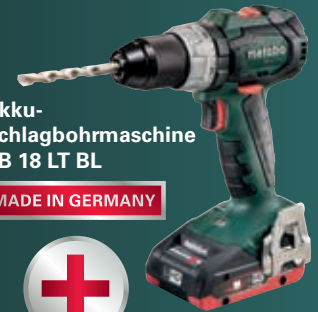
Akku-Schlagbohrmaschine SB 18 LT BL