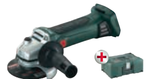
Akku-Winkelschleifer W 18 LTX 125 Quick Bestell-Nr. 602174840