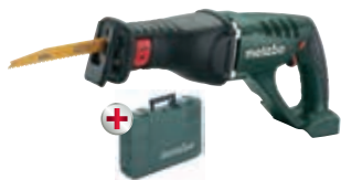
Akku-Säbelsäge ASE 18 LTX Bestell-Nr. 690815000