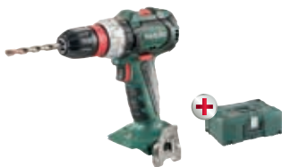
Akku-Bohrschrauber BS 18 LT BL Q (Brushless-Motor) Bestell-Nr. 602334840