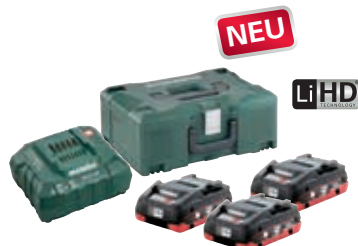
Basis-Set 3 x LiHD 4.0 Ah 1 x Ladegerät ASC 30-36 V Bestell-Nr. 685133000