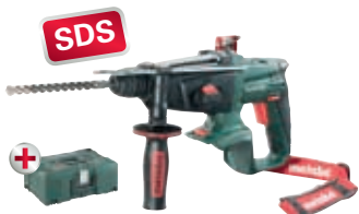
Akku-Kombihammer KHA 18 LTX Bestell-Nr. 600210840